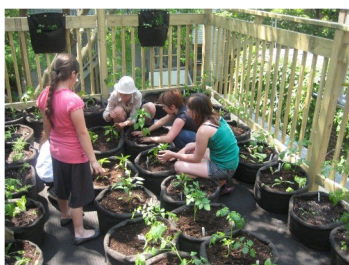
Le club de jardinage en action sur le toit du Jardin pour grandir!

Les deux journées « porte ouverte » au Pignon Bleu