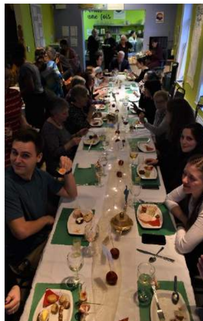
Soirée reconnaissance pour remercier le dévouement et l'implication de nos bénévoles et stagiaires

Soulignons que plusieurs d'entre eux restent en contact avec l'organisme après la réalisation de leur stage, en s'impliquant notamment à titre de bénévole pour différentes activités ponctuelles. Lorsqu'il en a la possibilité, Le Pignon Bleu favorise l'embauche de ces personnes dans le cadre des programmes d'emploi d'été ou au sein de son équipe de travail.